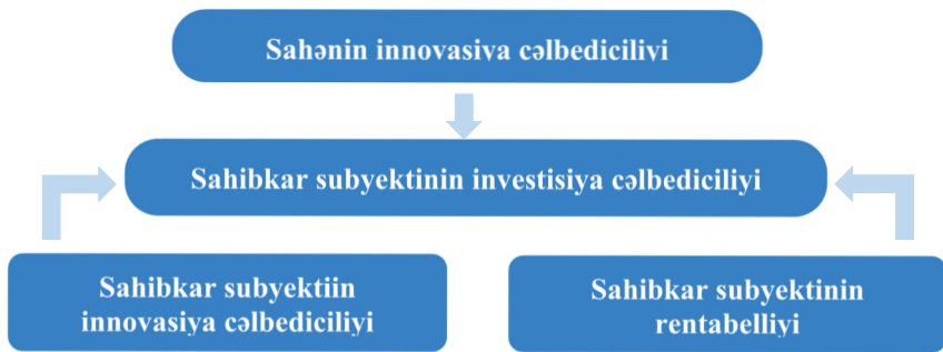
Şəkil 1. Sahibkar subyektinin investisiya cəlbediciliyinin formalaşdırılması

Mənbə: şəkil müəllif tərəfindən tərtib olunub.