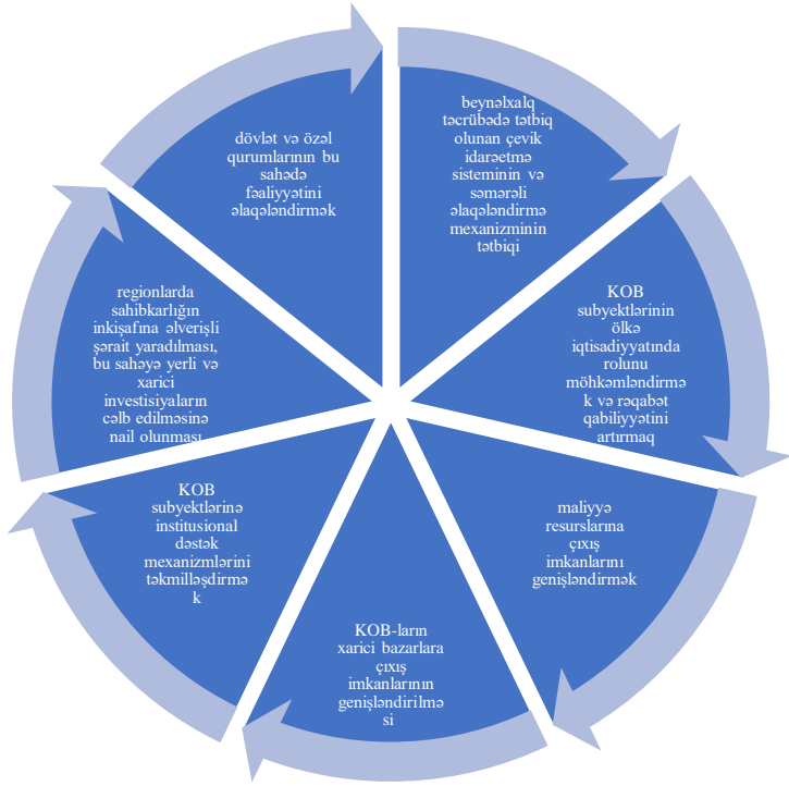
Şəkil 3. Sənaye istehsalının klasterləşməsində kiçik və orta sahibkarlığın rolu: rəqabət qabiliyyətinin artırılması və effektiv koordinasiyanın tətbiqi məsələləri (müəllifin yanaşması)

məşğulluqda payının artırılması, rəqabət qabiliyyətinin gücləndirilməsi müasir iqtisadi siyasətin önəmli məsələləridir. KOB subyektlərinin maliyyələşmə resurslarına sərfəli və səmərəli çıxışının təmin edilməsi, zəruri istehlak malları ilə təminatın əsasən KOB subyektləri vasitəsilə həyata keçirilməsi, KOB-ların xarici bazarlara ekspansiya imkanlarının genişləndirilməsi strateji hədəflər kimi müəyyən edilmişdir.