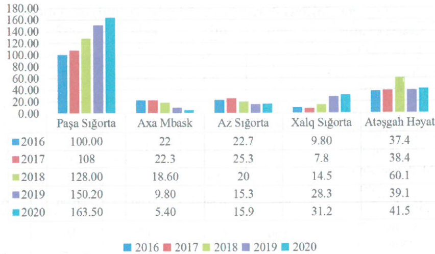
Qrafik 1 Sığortaçılar üzrə hesablanmış ümumi sığorta haqlarının dinamikası