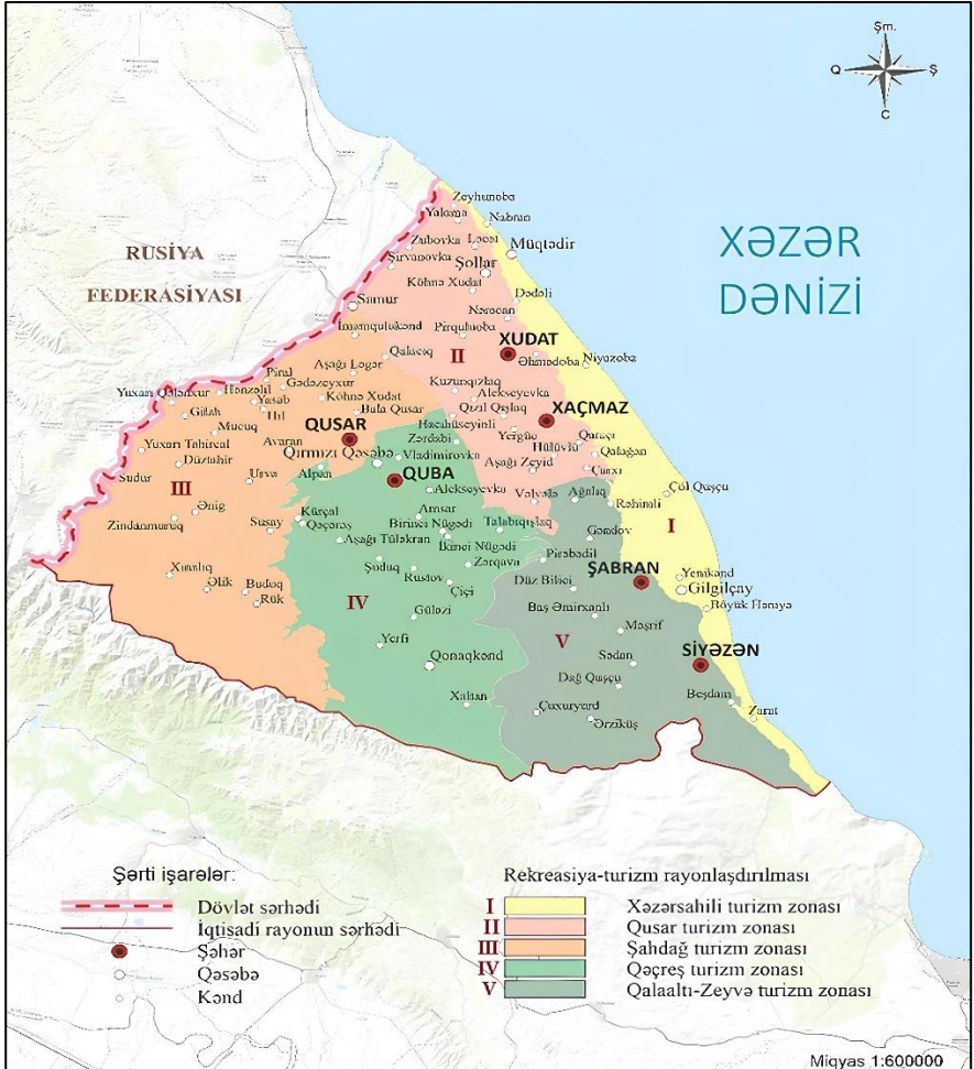
Şəkil 2. Quba-Xaçmaz iqtisadi rayonunun rekreasiya-turizm rayonlaşdırılması (Müəllif tərəfindən tərtib edilmişdir)

sağlamlıq və müalicə kurort-santoriyalarının yaradılmasına nail olmaq mümkündür.