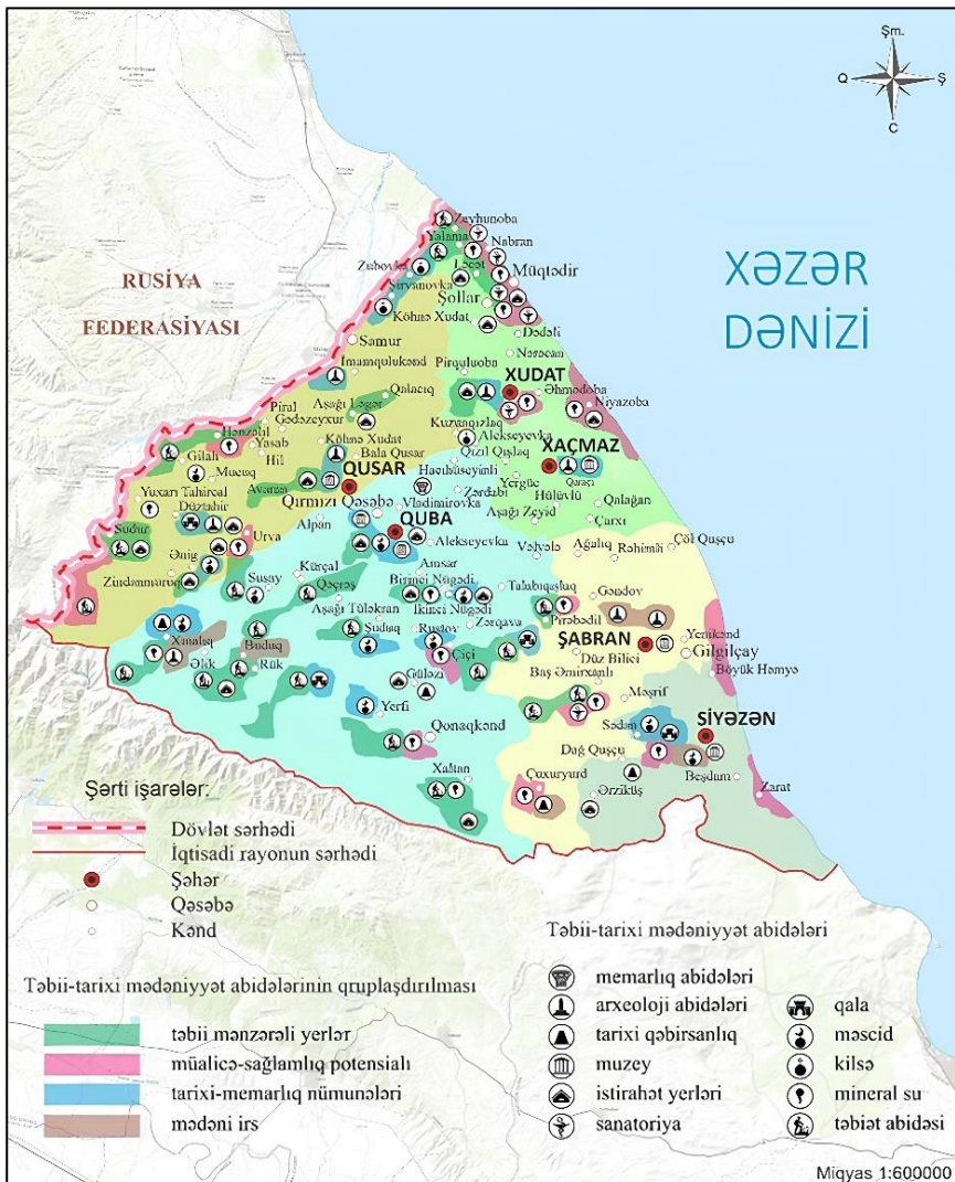
Şəkil 1. Quba-Xaçmaz iqtisadi rayonunda təbii və tarixi mədəniyyət abidələri və onların qruplaşdırılması (Müəllif tərəfindən tərtib edilmişdir)

Tərtib etdiyimiz xəritədə yalnız təbii və tarixi mədəniyyət abidələri deyil, eləcə də onların bazasında potensial turizmin