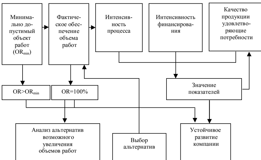
Рисунок 5. Алгоритм организации управления производственным процессом в строительной компании

Поэтому следует создавать системы организации и управления производственными процессами, которые выпускают на рынок реальный продукт. Критериями управления, видимо следует считать интенсивность процессов, интенсивность финансирования, качество продукции и услуг (рисунок 5).