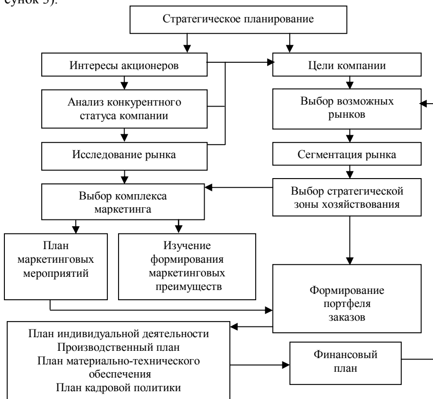
Рисунок 3. Схема организации стратегического планирования компании

разница между целями и средствами. Важным условием устойчивого развития компании, также является стратегическое планирование (рисунок 3).