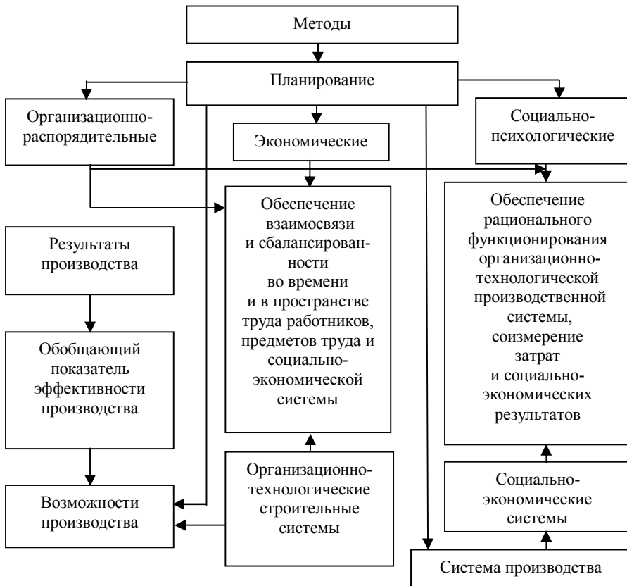
Рисунок 4. Управляющая система для менеджмента

ственный) и духовный интерес в достижении планируемых хозяйственных целей (рисунок 4).