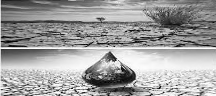
Şəkil 2. Vizual kontrast və koqnitiv paralel emal mexanizmi

J.Fodorun modulyarlıq nəzəriyyəsi burada koqnitiv arxitekturaya təsir göstərə bilən aspektlərdən də təhlillərə cəlb olunmuşdur. Fodor konsepsiyasına görə, koqnitiv arxitekturada paralel çoxluqlar sistemi mövcuddur və hər bir modul eyni zamanda müstəqil funksional bazaya da malikdir və ümumi arxitekturaya böyük təsir göstərir. “... modul impulsları qəbul edən və bir-birinə yaxın yerləşən neyronların qarşılıqlı təsirinəticəsində əlaqələri təmin edən çoxfunksiyalı vahiddir ” 59 . Məsələn, media diskursunda auditoriyanın gözü qarşısında canlandırılan hər hansı bir şəkli götürək: