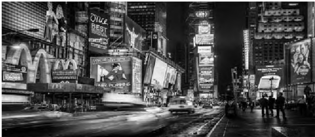
Şəkil 1. Reklam diskursunda vizual manipulyasiya və emosional kodlaşdırma nümunəsi

informasiyanın arxasında gizlədir. Bu cür quruluş auditoriyanın interpretasiya trayektoriyasını əvvəlcədən müəyyənləşdirir və alternativ oxu imkanlarını məhdudlaşdırır. Rəngarəng görüntülər, parlaq işıqlandırmalar, xoşbəxt insanların təsviri kimi məqamlar sadəcə media diskursunun eksplisit tərəfini canlandırmır. O cür valehedici görüntülər insan persepsiyası üçün məmnunluq yaradır: