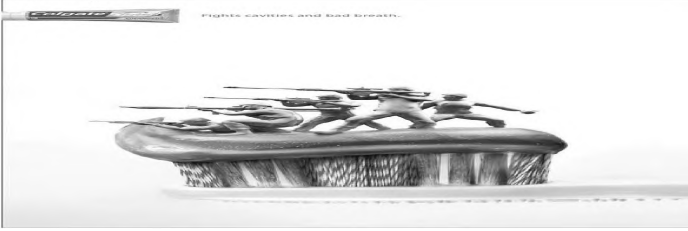
Şəkil 3. Təkrar vizual kodlaşma vasitəsilə stereotip konseptin formalaşdırılması

üzlərindən keçərək dinləyicinin mental bazasına göndərilən kodlar modulyar prinsipə uyğun olaraq avtomatik şəkildə üst qatın dekodlaşması ilə qısamüddətli yaddaşa, təkrarların çoxalması ilə sonradan uzunmüddətli yaddaşa ötürülür və stereotip konseptlər halında özünə yer edir.