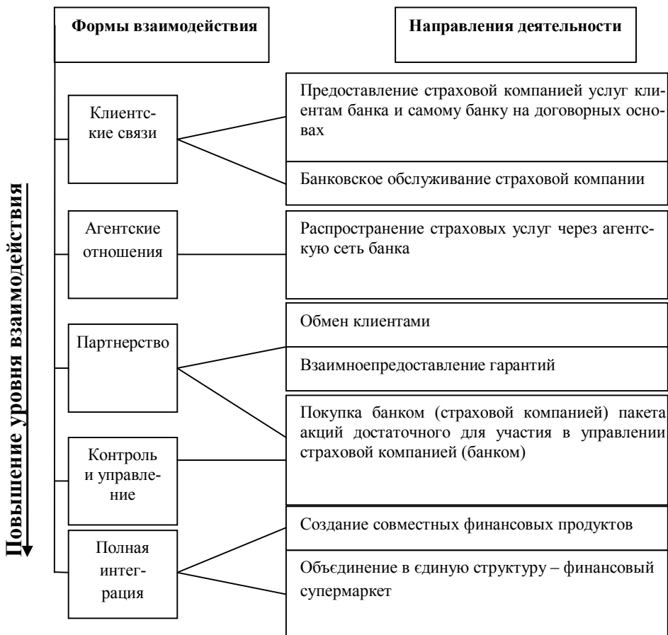
Рис. 2. Формы взаимодействия КБ и страховых компаний

Исследование зарубежного опыта свидетельствует о популярности страховых услуг среди потребителей и высоких достижениях банковского страхования. Реализация предложенных форм взаимодействия банковских и страховых учреждений будет, в конечном счете, способствовать повышению конкурентоспособности отечественных КБ, усилению их позиций по сравнению с иностранными конкурентами за счет сохранения и расширения клиентской базы, получению дополнительных доходов, проникновению на новые рынки, диверсификации капитала и дохода, увеличению нормы до-