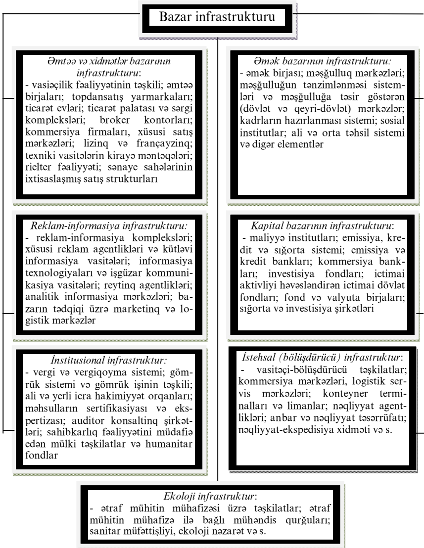
Şəkil 2. Xidmət etdiyi bazarın tərkibinə görə infrastrukturun təsnifatı

2. Milli iqtisadiyyata xidmət göstərən bəzi altsistemləri çoxsaylı funksiyalardan azad etmək və beləliklə də əmək bölgüsünün və kooperasiyanın inkişafına şərait yaratmaq;