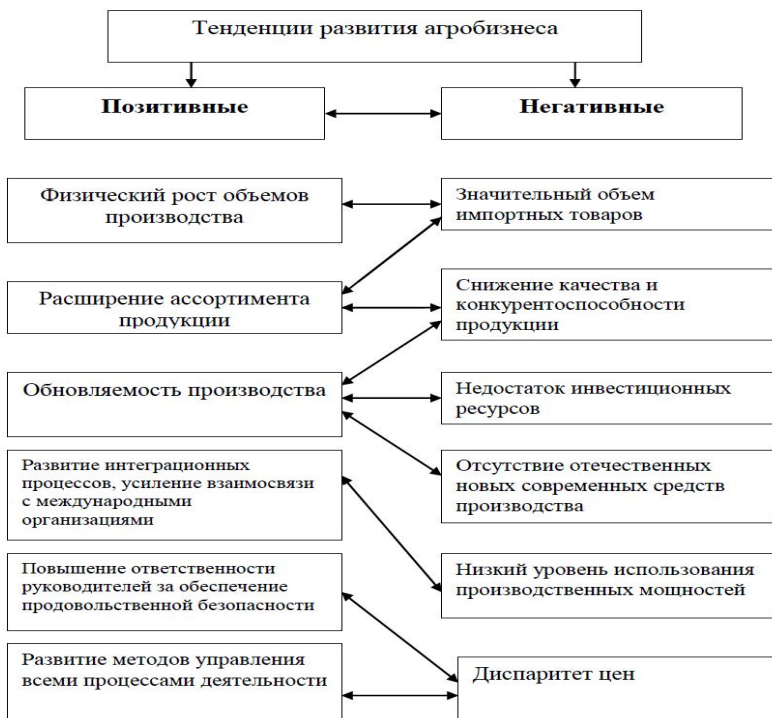
Рисунок 1. Противоречие тенденций развития агробизнеса