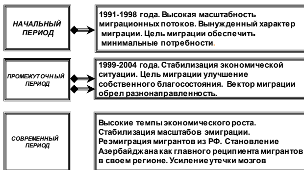
Рис. 1. Современная характеристика трудовой миграции в Азербайджане

эпоху отличалась четко дифференцированной структурой миграционных потоков с заранее определенными миграционными целями, и в своей основной массе относилась к сезонному ее виду. В переходный период же миграционное движение носило скорее хаотичный, бесцельный характер, как бы сказать миграция ради миграции, отличалось масштабностью. Вид миграции относился к временному виду.