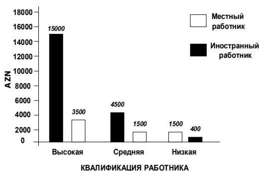
Рис. 3. Соотношение средней ежемесячной заработной платы местных работников с нерезидентами в иностранных энергетических компаниях в нефтегазовом секторе Азербайджана, 2015г.

номической жизни страны явление положительное. Однако, в этом факте обнаруживаются некоторые отрицательные моменты, с характерным усугублением создавшейся ситуации. Основное осложнение заключается в несоответствии профессиональной квалификации штата сотрудников иностранных предприятий структуре потребности в рабочей силе и неоправданная разница в заработной плате иностранцев с местным населением. Данная противоречивость проявляется, как и среди высококвалифицированных, так и низкоквалифицированных работников (рис. 3).