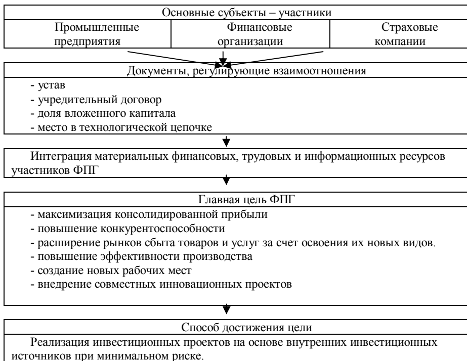
Рис 1. Рекомендуемая структура ФПГ и ее основополагающие элементы.

мышленных и финансовых организаций можно достичь желаемых результатов в ненефтяном секторе экономики нашей республики. Основанием для рассмотрения объединения хозяйствующих субъектов как ФПГ является, по нашему мнению, не официальный статус, а наличие общих черт и признаков в их поведении и оформлении выпускаемой продукции.