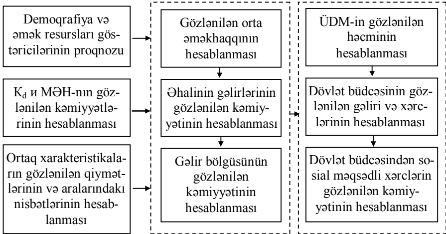
Şəkil 2. Sosial inkişaf və diferensiasiya xarakteristikalarının proqnoz hesablamalarının blok-sxemi (“təkamül variantı”)

Altıncı blokda dövlət büdcəsinin sosial məqsədlər üçün xərc göstəriciləri proqnozlaşdırılır. Burada xərclərin beş tərkib hissəsi fərqləndirilir: səhiyyə, təhsil, mədəniyyət, rekreasiya və sosial müdafiə.