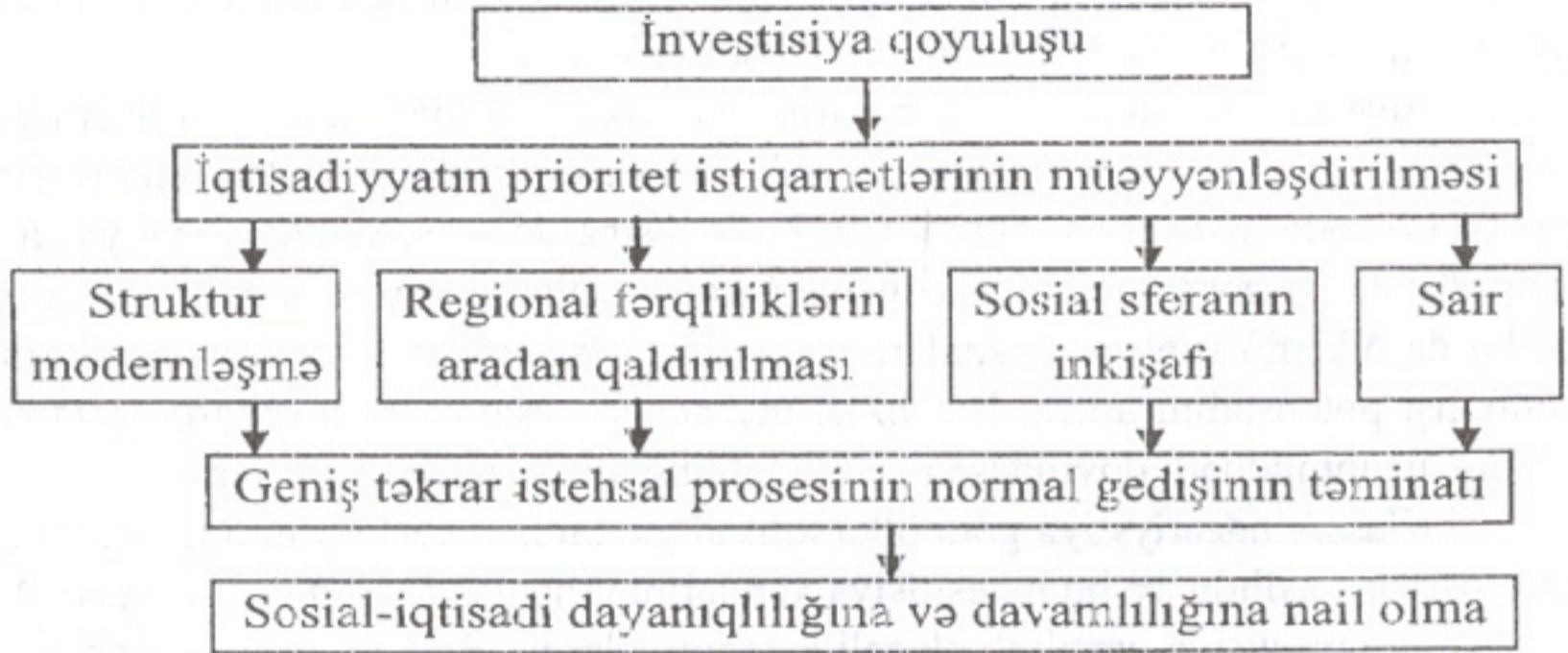
Şəkil 1. Dayanıqlı inkişafı investisiya qoyuluşu arasında əlaqə

Digər tərəfdən, firmalar investisiya qoyuluşu haqqında qərarı bazar konyukturası haqqında məlumatlar əsasında qəbul edirlər. Belə ki, əgər bazarda tələb artırsa və müəssisənin istehsal gücü bu tələbi ödəmək səviyyəsində deyilsə, onda əlavə investisiya qoyuluşu həyata keçirilə bilər. Lakin sahibkar investisiya qoyuluşunu həmişə tələb artdıqda deyil, yalnız bu tələbin sabitliyinə inam yarandıqda həyata keçirir. Keyniz nəzəriyyəsinə görə iqtisadi artım tempi yığına meyillik və investisiya qoyuluşlarının həcmi və səmərəliliyindən asılıdır.