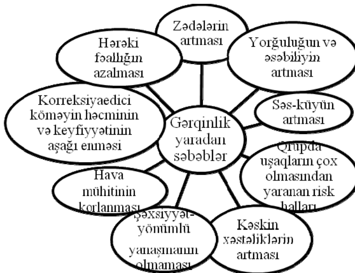
Sxem 1. Təlim prosesində gərginlik yaradan səbəblər

Yarımfəsildə təlim prosesində gərginlik yaradan səbəblərdən birinin qrupda uşaqların sayının çox olması qeyd olunur və göstərilir ki, belə hallarda uşaqların səhhətində və vəziyyətində bir sıra problemlər müşahidə olunur. Bunu sxemdə görmək olar.