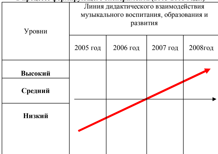
График роста показателей в процессе формирующего эксперимента (2005-2008 годы)

В целом, в процессе формирующего эксперимента жирная линия, указывает на реальное и активное повышение уровня дидактического взаимодействия в экспериментальных группах детской филармонии и Детской музыкальной школы № 6, а не жирная указывает на неизменный средний уровень в контрольных группах Детских музыкальных школ №16 и 35.