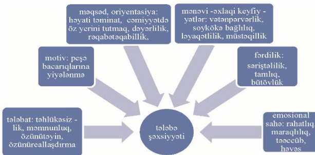
Şəkil 2.1. Tələbə şəxsiyyətinin pozitiv inkişaf modeli

Fəslin “Tələbə şəxsiyyətinə təsir göstərən psixoemosional hallar” adlı ikinci yarım fəslində tələbə şəxsiyyətinin formalaşmasına psixoemosional proseslərin təsiri müəyyənləşdirilir. Əvvəlcə tələbə şəxsiyyətinin strukturunda emosional halların yeri müəyyənləşdirilmişdir. Bunun üçün aşağıdakı pozitiv inkişaf modelindən istifadə edilmişdir.