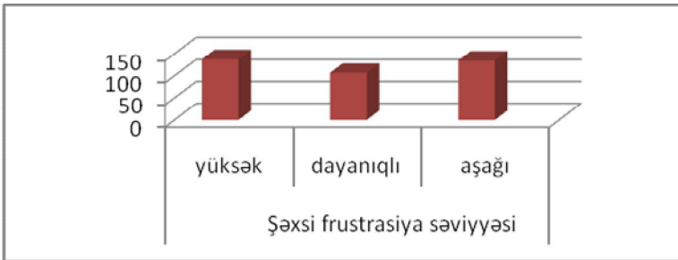
Şəkil 2.2. Tələbələrdə frustrasiya səviyyələrinin korrelyasiyası

I kurs üçün yüksək - 53 nəfər (45,2%), II kurs üçün dayanıqlı - 38 nəfər (37,6%), III kursda - yüksək frustrasiya səviyyəsi, IV kursda bu göstəricinin aşağı düşməsi səciyyəvidir - 36 nəfər (54,5%).