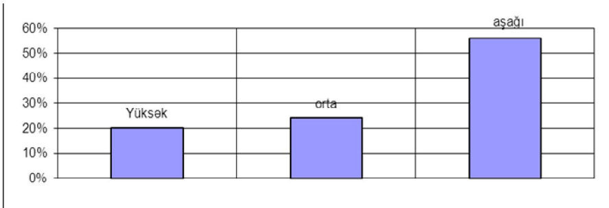
Şək. 3.1. Norma və qaydaları pozmağa meylliliyin səviyyələri