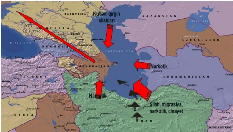
Şək.3.2. Azərbaycan Respublikasının tranzit əhəmiyyəti

“Azərbaycan Respublikasının sərhəd mühafizəsinin regional təhlükəsizliyə təsiri” adlanan üçüncü yarımfəsildə qeyd edilir ki,Azərbaycanın dövlət sərhədlərində təhlükəsizliyin təmin olunmasının regional təhlükəsizlik baxımından əhəmiyyəti çox böyükdür.Azərbaycanın geosiyasi və geoiqtisadi baxımdan Avrasiyanın giriş qapısı, Şərq-Qərb nəqliyyat-kommunikasiya və enerji dəhlizlərinin kəsişdiyi bir yerdə yerləşməsi, Trans-Asiya nəqliyyat dəhlizində əsas bağlayıcı ölkələrdən biri kimi çıxış etməsi onun malik olduğu dövlət sərhədlərinin etibarlı mühafizə olunmasının regional təhlükəsizlik baxımından əhəmiyyətini daha da artırır.