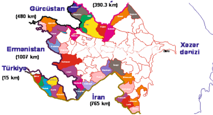
Şək.2.1 Azərbaycanın sərhədboyu rayonları

XX əsrdə ikinci dəfə öz müstəqilliyini 1991-ci il oktyabrın18-də bərpa edən və ümumi ərazisi 86.6 min km 2 olan Azərbaycan Respublikasının dövlət sərhədlərinin 2647 kilometrini quru sərhədləri, 713 kilometrini isə dəniz sərhədləri təşkil etdi.