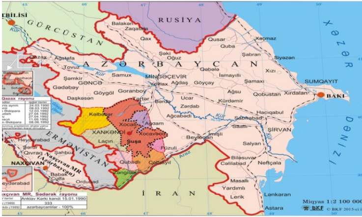
Şək.3.1. Azərbaycanın Ermənistan tərəfindən işğal olunmuş və hazırda azad edilən hissələri

Azərbaycan-İran və 360 kilometr Azərbaycan-Ermənistan sərhədləri, bütövlükdə isə 558 kilometr dövlət sərhədləri Ermənistan silahlı qüvvələri tərəfindən işğal olunmuşdur.