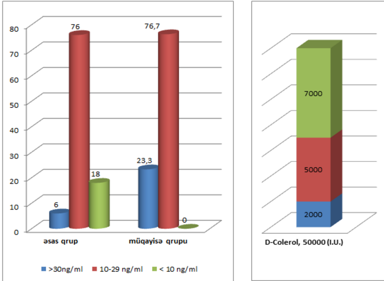
Qrafik 2. D vitamini defisitindən asılı olaraq, D-Colerol 50000 B.V. doza asılı preparatın qəbulu

müqayisə qrupundan olan 3 qadında ( 10,0±5,5%) yüngül hiperkalsemiya müşahidə edilmişdir. Əsas qrupdan olan 4 qadında (8,0±3,8%) gündə 7000 B.V. doza qəbul edərkən bu ağırlaşma müşahidə edilmişdir (qrafik 2).